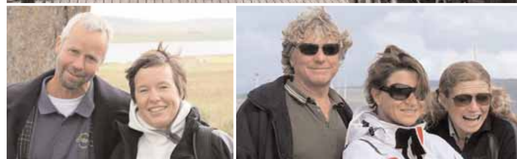
Håkans stolta planer på långsegling till Skottland